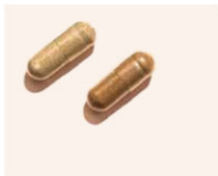
timeblock® VITAL AGING NUTRITION